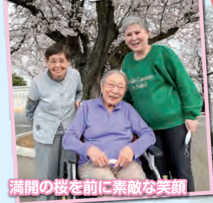
満開の桜を前に素敵な笑顔