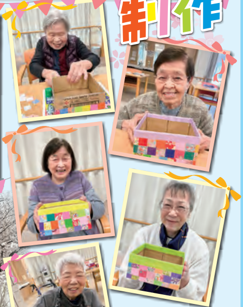
折り紙を貼り小物入れ作り 柄と無地が交互になるよう丁寧に... 綺麗に出来ました。