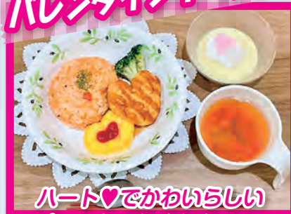
ハート♥でかわいらしいプレートにしました