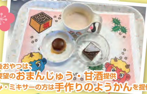
午後おやつは、 ご要望の おまんじゅう ・ 甘酒 提供 刻み・ミキサーの方は 手作りのようかん を提供