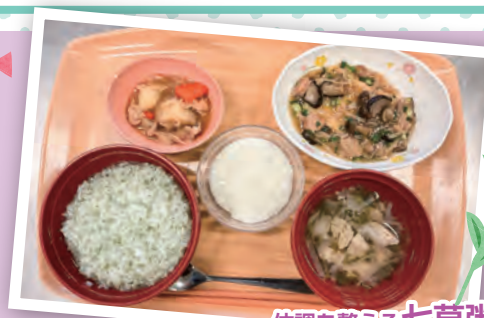
体調を整える 七草粥 提供