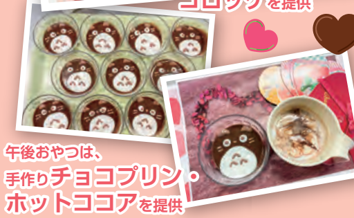
午後おやつは、 手作りチョコプリン ・ ホットココア を提供