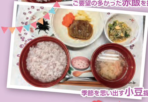
季節を思い出す 小豆 提供