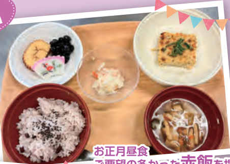
お正月昼食 ご要望の多かった 赤飯 を提供