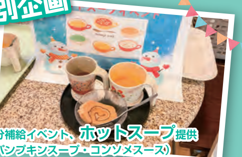
水分補給イベント、 ホットスープ 提供 (パンブキンスープ・コンソメス)