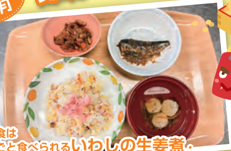
昼食は 骨ごと食べられる いわしの生姜煮 ・ いわしつみれ汁 いわしづくしでした。